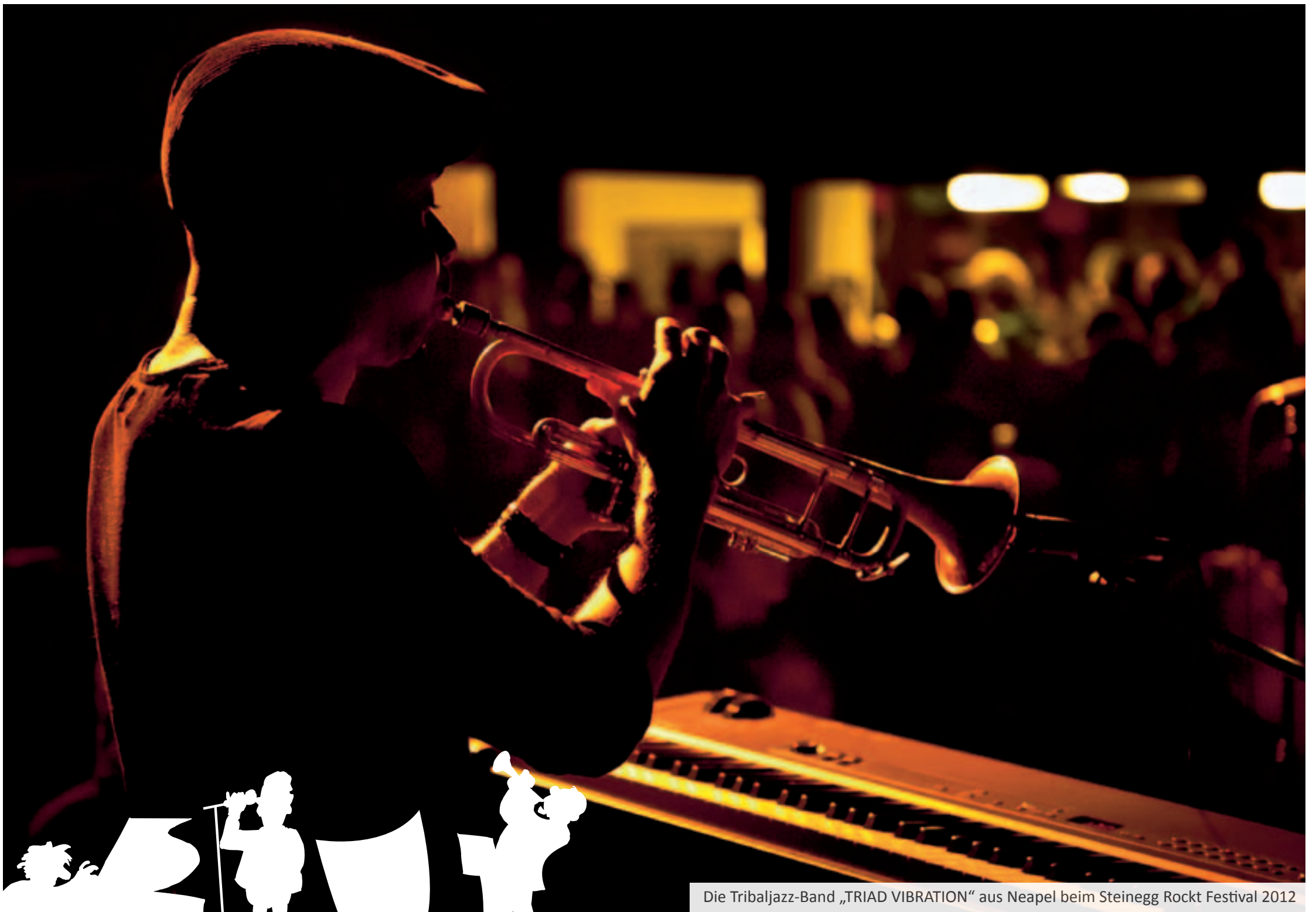
Die Tribaljazz-Band „TRIAD VIBRATION“ aus Neapel beim Steinegg Rockt Festival 2012