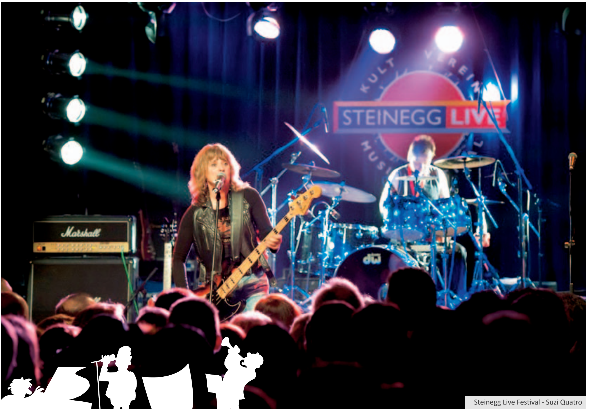
Steinegg Live Festival - Suzi Quatro